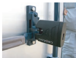
鑄造金具と南京錠