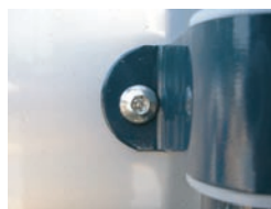
特殊ステンレスネジ